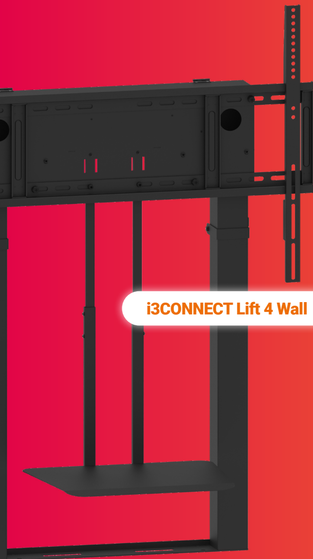
i3CONNECT Lift 4 Wall